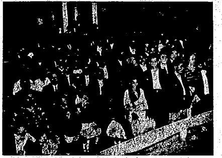
Hasta en los pueblos más pequeños la voz de la C. N. T. despierta la esperanza de los oprimidos y fortalece la fe en un mundo mejor. En Evandro, Vizcaya, durante la celebración de un mitin convocado por el sindicato socialista.