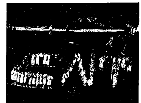
Riñas de Freser. — Las compañeras y compañeros, reunidas en jira el 1.º de mayo, componen para la foto las tres iniciales de la Confederación.