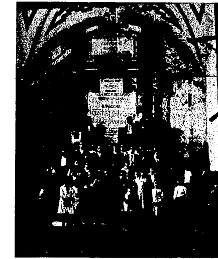
Reunión de Sabinosa. — Interior de la ex iglesia del pueblo, hoy local del Sindicato de la Constitución y Vías Férreas por voluntad exclusiva de los trabajadores.

trabajadores. Si los intereses privados de los dirigentes de los partidos políticos que tienen ascendente en una parte de los organismos obreros malogran la realización de ese acuerdo de los productores, allá con su responsabilidad ante la historia y ante su conciencia. Pero por parte nuestra es preciso no abandonar la plataforma de lucha revolucionaria aprobada en el congreso reciente: tarde o temprano, y ojalá que aun sea temprano, las masas laboriosas encontrarán el camino del acuerdo, pasando por sobre sus jefes y rompiendo con sus prejuicios y con los odios artificialmente amantados. Si la C. N. T. y la U. G. T. llegasen a concertar el pacto de acción revolucionaria conjunta, ¿qué política y el fascismo en España, y qué podría resistir ya el calvario de la democracia? El acuerdo es la revolución social; el desacuerdo es el triunfo del fascismo. ¿Ha de sacrificarse la revolución al fascismo por el interés particular de unos cuantos diputados o por la ambición fúnebre de unos cuantos aspirantes a ministros de la burguesía? Pronto sabremos a qué atenernos.