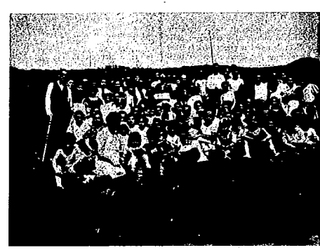
Ribera del Deusto (Bilbao). — Asistentes a la jira comarcal celebrada el 3 de mayo en el pueblo de Arrigorriaga.

El día que aparezca la bandera gamada en los edificios públicos, no