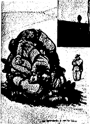
El arte de Castelao

ESPAÑA TODA ESTE LIMPIA DE FASCISTAS Y AFIRMADA EN SUS NUEVOS CIMIENTOS REVOLUCIONARIOS