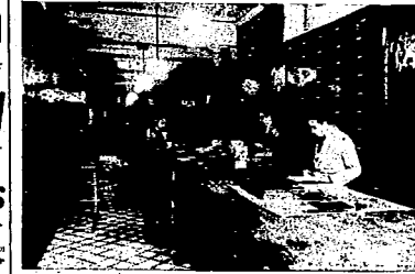
ALMACEN.—SALA DE VENTAS