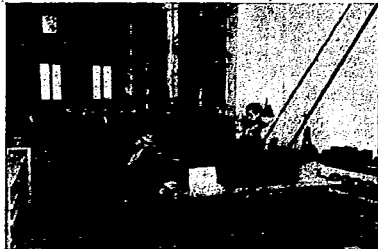
FABRICA.—MAQUINAS PARA PULIR LOS CRISTALES