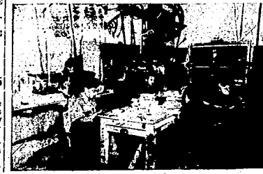
ALMACEN.—TALLER DEL MONTAJE DE LAS GAFAS

de batalla. —¿Qué pensáis de la marcha de la guerra?—les preguntamos. —Que en España entrará el fascismo. Tal vez no alcance la altura para cubrir a todos los fascistas que caigan. Pero no importando la causa que con tanto sacrificio y tanto heroísmo defienden los hombres en los frentes de batalla.