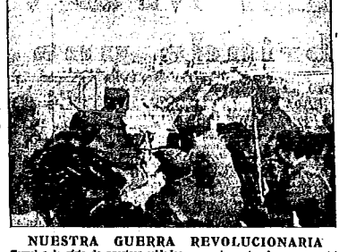
NUESTRA GUERRA REVOLUCIONARIA