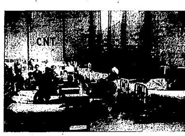
SALA DE CIRUGIA GENERAL