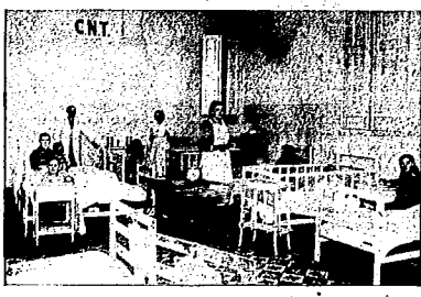
SALA DE NIÑOS