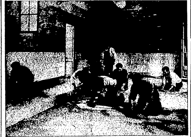
CONSTRUYENDO UN PAVIMENTO ATERMICO

—¿Qué hecho os merece el Pleno Nacional Ampliado que acaba de celebrarse en Valencia? —Este Pleno Nacional Ampliado que se acaba de celebrar en Valencia ha sido de una importancia extraordinaria. Con él el C. N. T. ha demostrado una vez más estar a la altura de las circunstancias. —¿No fue la guerra... la C. N. T. podría demostrar ante el universo, que es capaz de organizar una nueva economía, superando los viejos modelos capitalistas y de economías piratas. —¿Cuál creéis que es el deber de todos los trabajadores en estos momentos trascendentales para la Revolución? —Todos los trabajadores deben adherirse a las consignas que difunden de los acuerdos de la organización y pro-