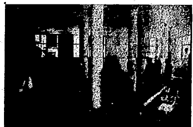
EN PLENA LABOR

Y cuando la guerra civil se convirtió en una guerra prolongada e implacable, con todas las armas y con todos los recursos de los países fascistas, los compañeros de la construcción siguen combatiendo en todos los frentes las más emocionantes y bellas páginas de heroísmo; páginas que hay que guardar cuidadosamente, silenciosamente, pero que un día serán el ejemplo luminoso de las generaciones futuras.