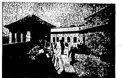
TRABAJANDO EN UN TERRADO

—Para ganar la guerra lo principal es la unión de todos los proletarios en