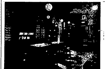
LA BIBLIOTECA DE UN TALLER CONFEDERAL

—¿Habéis realizado alguna obra cultural? —Ha sido siempre nuestra primera preocupación. Aparte de las mejoras de higiene implantadas en todos los lugares de trabajo como son las duchas, los lavabos, los guardarropas, etc., boliches y salas de primeros auxilios, hemos organizado bibliotecas, salas de lectura y conferencias, cursos de preparación de primeros auxilios; hemos construido magníficas piletas de natación, etc. —¿Cuál creéis que es el deber de todos los trabajadores en estos momentos trascendentales para la Revolución? —Todos los trabajadores deben adherirse a las consignas que difunden de los acuerdos de la organización y pro-