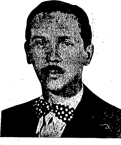
ES DEBER de los Partidos y Organizaciones del FRENTE POPULAR...