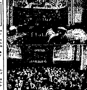
«La mujer española, que fuera de los más...