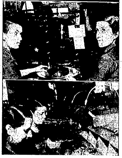
ACABA DE APARECER EL NUMERO 12 DE "MUJERES LIBRES" UNA EXPOSICION: EXACTA DE LOS PROBLEMAS ESENCIALES DEL MOMENTO