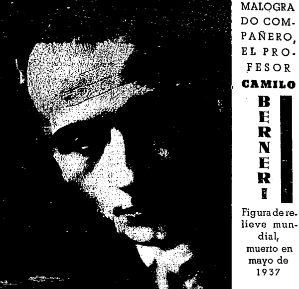
NUESTRO MALOGRADO COMPAÑERO, EL PROFESOR CAMILO BERNECKER. Figura de relieve mundial, muerto en mayo de 1937

¡COMBATIENTES PROLETARIOS! NOSOTROS AQUÍ DEFENDAMOS LA INDEPENDENCIA Y LA LIBERTAD DE ESPAÑA, QUE NINGUN TEMOR ALIBERGUE VUESTRO CORAZON, DEFENDEIS VUESTROS IDEALES, VUESTRA ESPAÑA, VUESTRO PORVENIR, ¡MAYO, CAMARADAS, COMBATID!