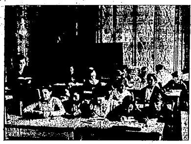
UNA CLASE DE CULTURA GENERAL

Algún día que a la Enseñanza debe darse una vibración de ternura y mientras capaces de palpitarle maternidad. Por eso la nueva enseñanza, la verdadera enseñanza popular, ha de ser accesible a los humildes, se basará en las grandes verdades de la vida y tendrá calor de hogar.