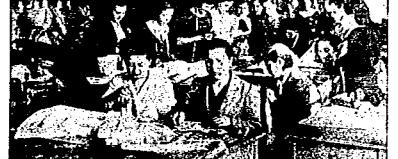
CORTE Y CONFECCION: TALLER

Las clases se dan todas las tardes menos el domingo y sábado, en que la necesidad de anonoriarse se hace más apremiante.