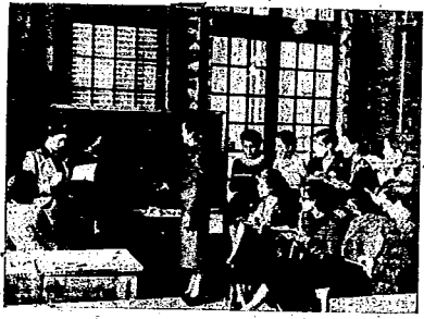
EL CURSO DE TAQUIGRAFIA EN PLENA LABOR

Las tres compañeras desempeñaron meritoriamente tales cargos hasta diciembre, en que se unificó la dirección del "Casal", ha-