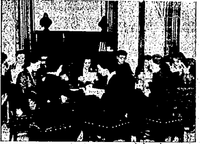
UNA VISTA DE LA BIBLIOTECA

Las clases de Taquigrafía, impartidas a dos grupos, duran unos