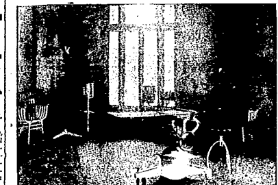
El Quirófano del Sanatorio