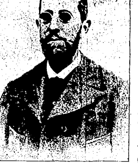
D. A. DE SANTILLAN Y SOLEDAD GUSTAVO ESCRIBEN