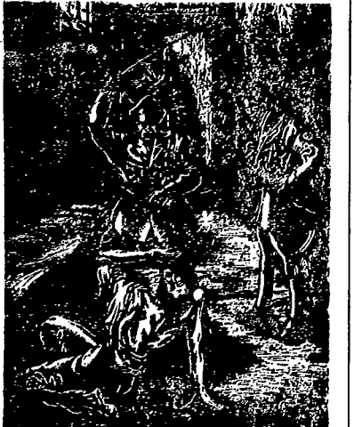
Escenas cotidianas en los campos de concentración alemanes

Existen dos Españas. La una, es la España de los traidores; de aquellos que no dudan ni un momento, para poder calmar sus desmedidas ambiciones, en entregar al extranjero su patria. Esta es la España negra, hoy en poder de los franquistas que, el príncipe de Júpiter Español y Hamánolo patriotas, la hipotecan al extranjero.