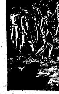
Escenas cotidianas en los campos de concentración alemanes

EX MINISTRO DE SANIDAD ANTIQUO MILITANTE ANTIFASCISTA Dice conocer a algunos de los detenidos por causas de los milicianos y literatos, y también como antiguos militantes antifascistas. Que fue enviada por el Gobierno para arrestar los disturbios de mayo, que ni el P. O. U. M. ni la O. N. T. F. A. U. tuvieron ninguna intervención en los sucesos referidos. Añade que el movimiento de mayo te-