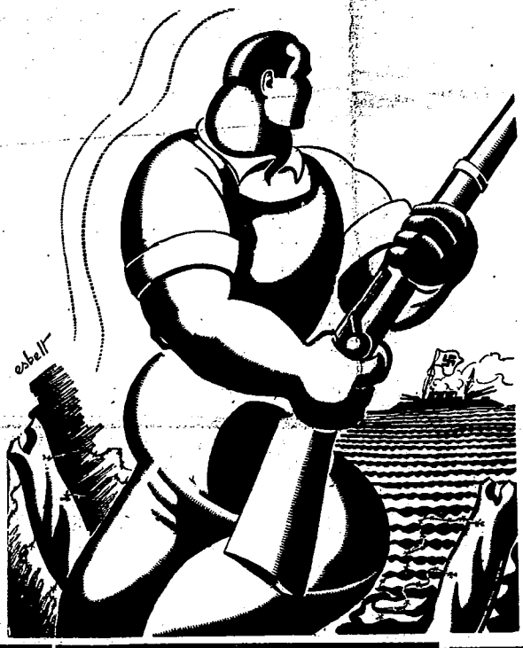
EN LAS BAYONETAS DE LOS LUCHADORES ESPAÑOLES CONTINUAN PRENDIDOS LOS DEL PROLETARIADO MUNDIAL. QUE ESTE LO MEDITA Y OBRE EN CONSECUENCIA